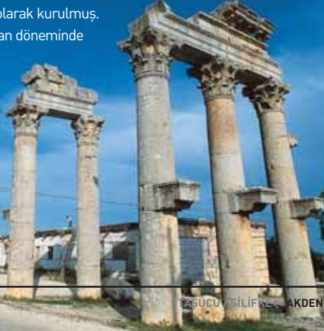
TAŞUCU / SİLİFKE - AKDENİZ 7

H alen 3000 kişinin yaşadığı Uzuncaburç denizden 1200 metre yükseklikte, ilçe merkezinin 30 km. kuzeyinde etrafı ormanlarla kaplı bir yayla üzerinde kurulu. Doğu Akdeniz'in en etkileyici ören yeri sayılan Uzuncaburç, bir Hitit yerleşimi olan Olba kentinin kutsal yeri olarak kurulmuş. Roma imparatoru Domitian döneminde hızla gelişip ayrı bir şehir olmuş ve Diocaesarea adını almış.